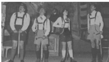
1 dicembre 1973 Paesi Manzoniani

Anche la Compagnia dell'Oratorio mise in scena il proprio spettacolo celebrativo, "Paesi manzoniani". Con temi musicali del maestro Giuseppe Mazzoleni, Togni e* Sacchi, partecipazione della ricostituita orchestra Azalea, parodie e scenette dei filodrammatici di Castello, andò in scena con grande successo il giorno primo dicembre. Fine dello spettacolo in linea con le normative di austerità: ore 23 in punto!