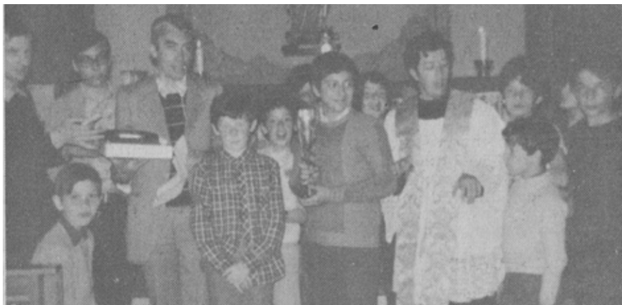
10 agosto 1973 chiusura anno oratoriano a Castello