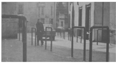
9 febbraio 1973 cavallotti e catenelle in Corso Matteotti