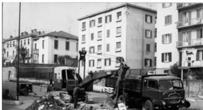
Scavi per le fognature in via F.lli Bandiera