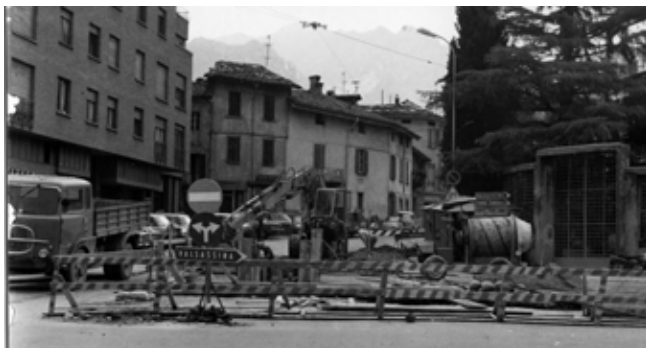
Lavori all'incrocio di Corso Matteotti - XI Febbraio - Giovanni XXIII

Un'ultima nota di attualità in questo periodo di Avvento: nel 1973 e ancora per un decennio circa, la benedizione delle case comprendeva anche le vie Petrarca, Catullo, Virgilio, Tasso, Stelvio e un pezzo di Viale Turati, poi passate alla parrocchia dei Cappuccini.