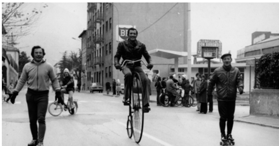
Corso Martiri - austerità 07.12.1973

In giro per Lecco, qualcuno si ricorderà, durante quelle domeniche si potevano vedere persone a cavallo, in pattini o in bicicletta e i pullman urbani erano stracolmi di passeggeri. Oltre al Palladium che, ovviamente, si era uniformato agli orari imposti, per Castello possiamo menzionare il fatto che anche il no-