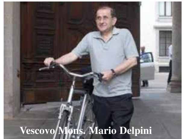
Vescovo Mons. Mario Delpini

E poi un invito concreto, ma fortemente simbolico: «È poi opportuno che la chiesa rimanga aperta, per quanto possibile».