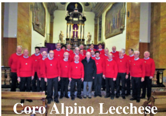
Coro Alpino Lecchese